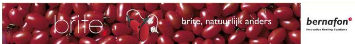
Voorbeeld banner 728x90 pixels

Een grotere (eventueel geanimeerde) banner op de onderwerp specifieke bladzijde met een formaat van 728x90 pixels heeft een meerprijs van 75 euro (ex BTW).